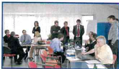
Nejen o projektech se diskutovalo ještě dlouho po vyhlášení výsledků