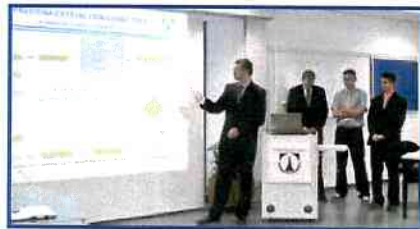
Tým KVS při finální prezentaci